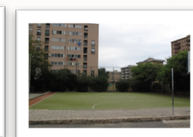
Campo di erba sintetica