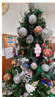
Attività "Addobbiamo l'albero"

La scuola individua percorsi specifici per gli alunni con Bisogni Educativi Speciali (BES, DSA) e diversamente abili. Promuove interventi educativi individualizzati, realizza laboratori ed attività per valorizzare l'individualità e la diversità di ciascun allievo.