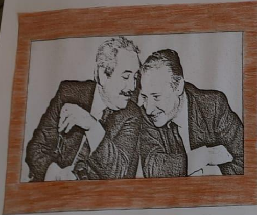
GIOVANNI FALCONE E PAOLO BORSELLINO.